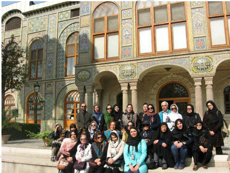
در تعطیلات نوروز.

نوروز ۹۴: برای اولین بار برنامه‌ریزی، طراحی و اجرای گشت‌ها و معرفی غرفه‌های داخل مجموعه برج میلاد به صورت محلی